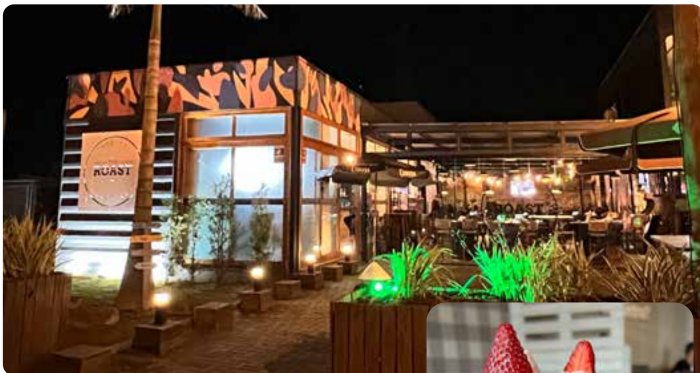
Acima, The Roast 82, em Nova Hartz

ria Koningin Bier , que tem uma degustação pocket harmonizada que inicia com Arancino e termina com sorvete de cerveja com geleia de goiaba. Um espetáculo.