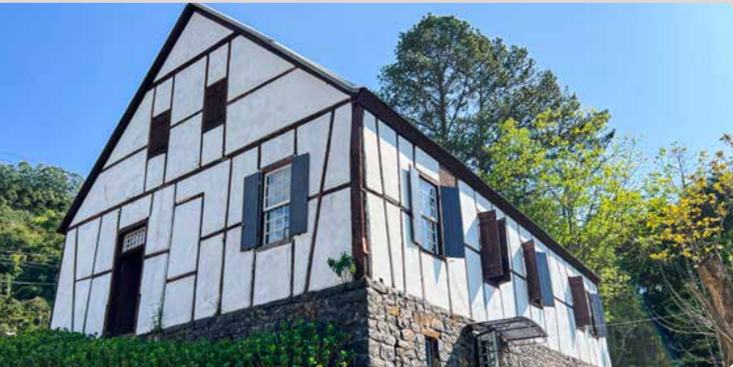
Santa Maria do Herval