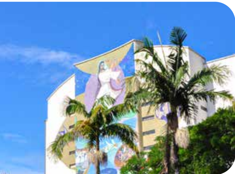
Santuário Sagrado Coração de Jesus - Padre Reus