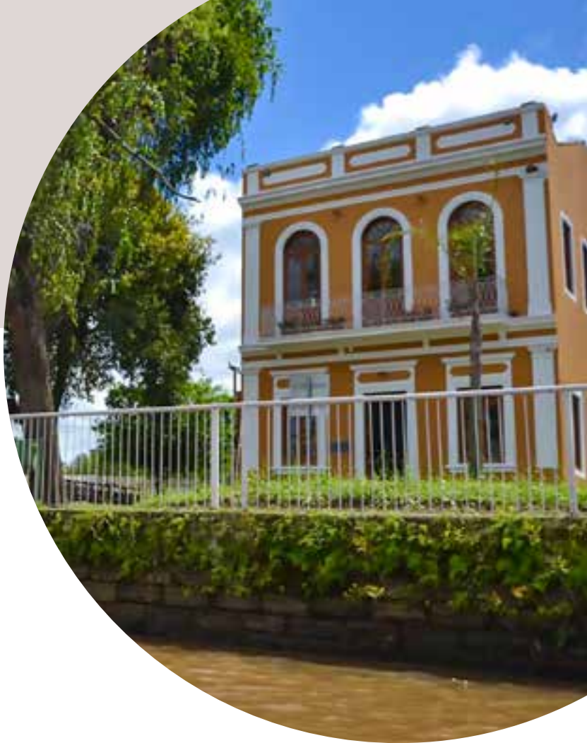
Museu do Rio, em São Leopoldo