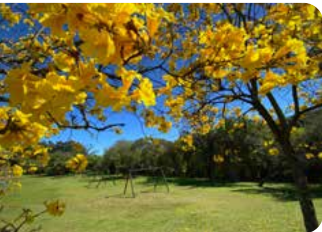
Praça de Lindolfo Collor

inclusive, um roteiro especial apenas para conhecer templos e santuários: Caminhos da Contemplação conta, por meio da religião, a história da colonização alemã e valoriza a espiritualidade, independentemente de credo. Sem contar, é claro, os aspectos arquitetônicos dessas construções históricas, algumas centenárias.