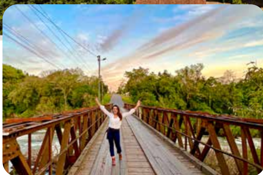
Avenida Mathias Steffens e Ponte de Ferro Engenheiro Daniel Ribeiro