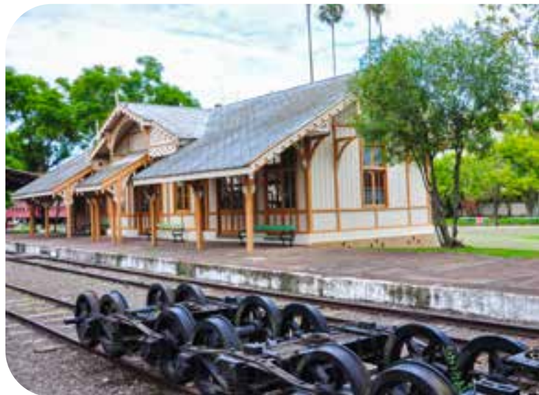
Museu do Trem