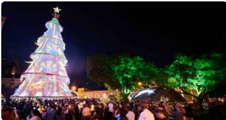
Natal dos Anjos, em Dois Irmãos

ws, atividades culturais e muita comida típica.