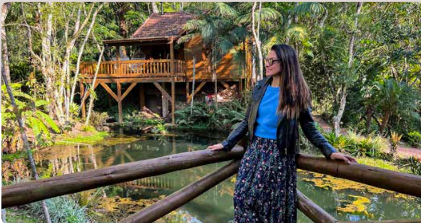
Pousada Chalés do Bosque, Nova Hartz