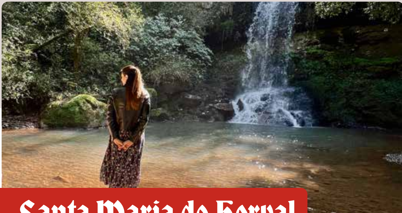
Cascata dos Bugres