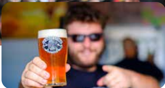
Chopp em metro