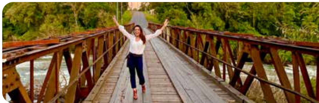
Ponte de Ferro Engenheiro Daniel Ribeiro

pênsil passa sobre o Rio Ca-deia. O balanço da construção obriga os visitantes que quiserem fazer a travessia a munir-se de muita coragem. Para quem gosta de aventura e frio na barriga, esse ponto turístico é bem indicado.